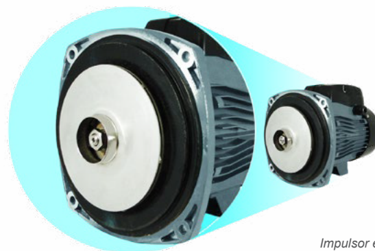
Impulsor en Acero Inoxidable